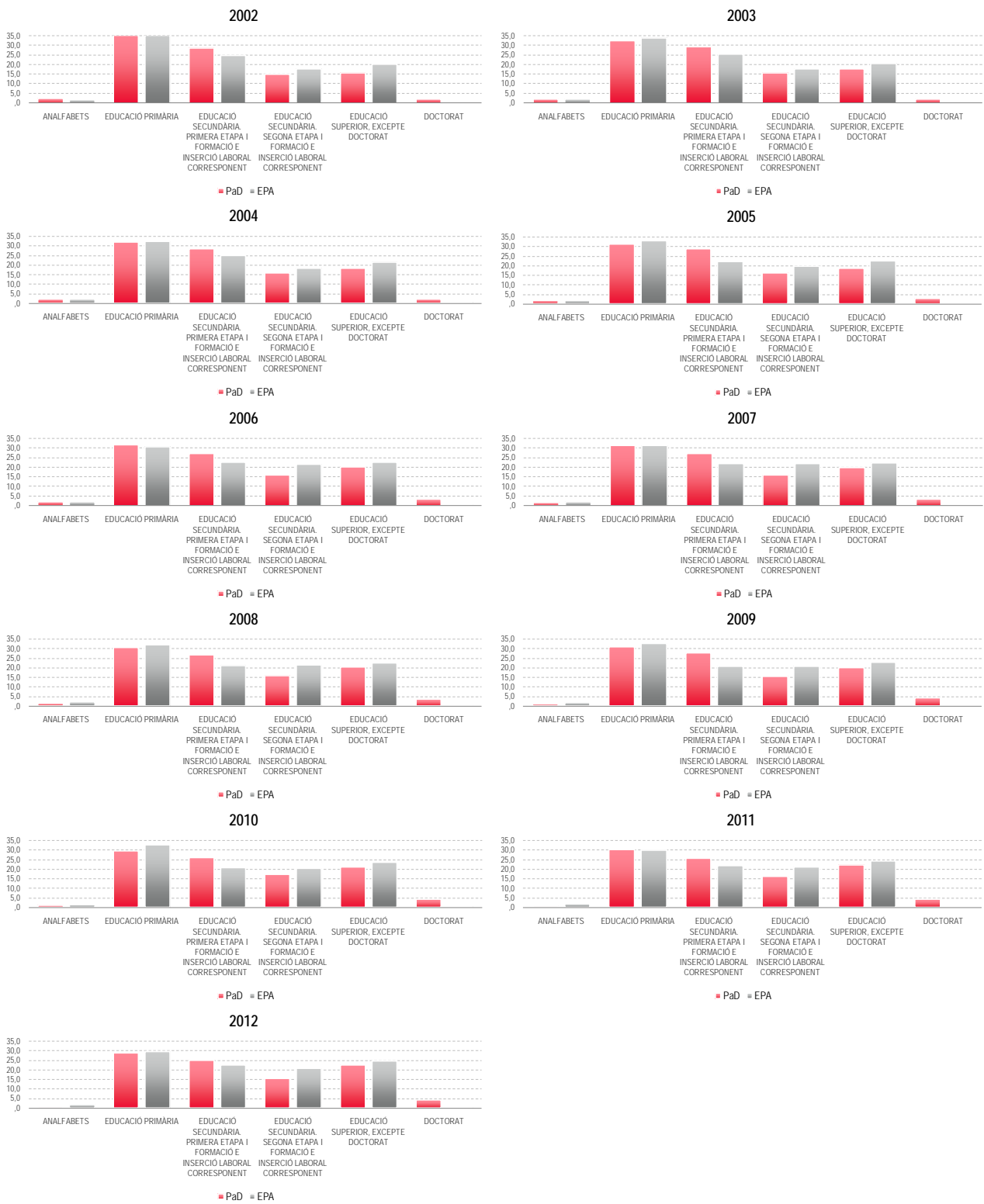
Figura 1. Validació nivell d'estudis del PaD en relació a l'EPA (evolució 2002- 2012)