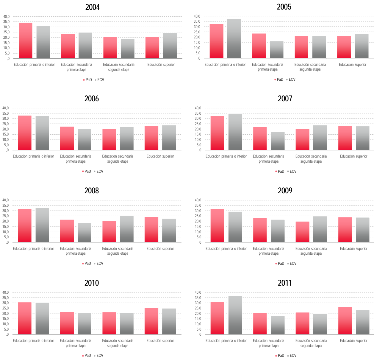
Figura 2. Validació nivell d'estudis del PaD en relació a l'ECV (Evolució 2004- 2011)

La validació de les dades en l'ECV queda truncada l'any 2011, ja que les dades per al 2012 no estan disponibles. No obstant, aquesta font de dades, tot i formar part de l'estadística oficial, presenta limitacions per a la comparabilitat: hem detectat importants variacions en els resultats sobre el nivell màxim d'estudis, durant els anys observats, variacions que no queda clar perquè succeeixen i que creen incertesa en relació a la qualitat de les seves dades. Entrant ja en la comparativa, es pot afirmar que les dades del PaD suporten bé la validació amb les dades de l'ECV. A grans trets, s'observa una infrarepresentació de l'Educació Primària o Inferior en el PaD l'any 2005 (5,1 punts) i en l'any 2011 (6 punts) i una infrarepresentació de l'Educació Secundària de Segona Etapa l'any 2007 (4,7 punts). En el nivell Educatiu Superior, tret de l'any 2004, les observacions són comparativament molt similars, amb diferències inferiors al 3,5 punts percentuals entre ambdós bases de dades.